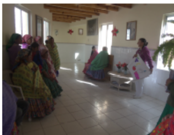
E D U C A C I O N