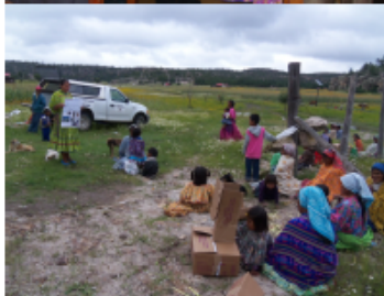
L A S A L U D