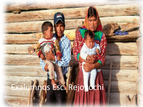
Exalumnos Esc. Rejojochi