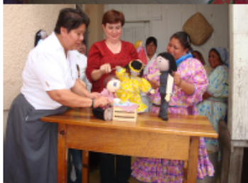
P A R A