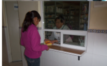
MEDICINAS Y TRATAMIENTOS ADECUADOS Y OPORTUNOS